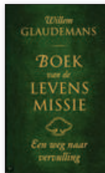
Boek van de Levensmissie - Een weg naar vervulling Uitgeverij Ankh Hermes, 2014

MEER INFORMATIE: WILLEMGLAUDEMANS.NL TALENTENSPEL.NL LEVENSSCHOUW.NL